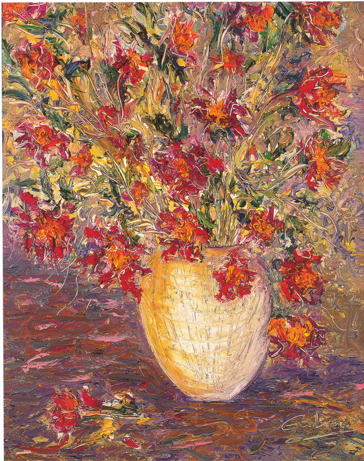
Antoine ABUGABER dit Antoine GABER - Nasturtium Still Life 1 , 2001, huile s/toile, 50,8x40,6 cm - CHF 146000.-